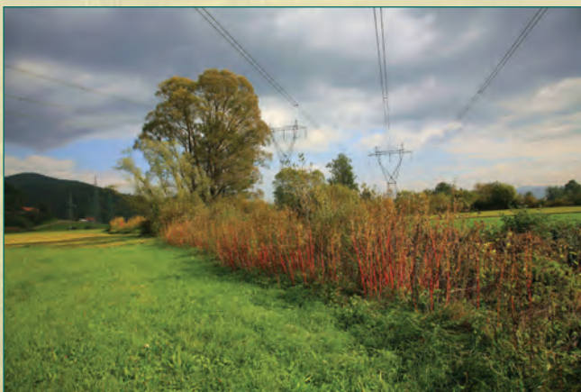
Visoka vegetacija ob potoku