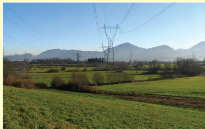
Mokrotni travniki z mejicami

Obrežja rek, kanalov in jarkov poraščajo predvsem grmovni sestoji. Izjemni krajinski videz območja dopolnjujejo mejice, ki predstavljajo ločnico med različnimi rabami prostora in skupaj s travniki in njivami prispevajo k večji biotski pestrosti. V prostoru mejice niso nikoli imele velikega gospodarskega pomena, imajo pa zato velik naravovarstveni in krajinski pomen. Tukaj najdemo zatočišče številne živalske in rastlinske vrste, ki bi drugače težko preživele.