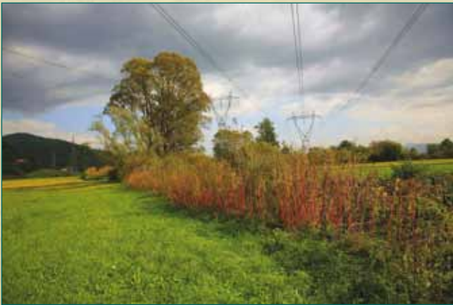
Visoka vegetacija ob potoku