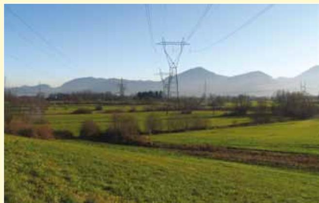
Mokrotni travniki z mejicami

Obrežja rek, kanalov in jarkov poraščajo predvsem grmovni sestoji. Izjemen krajinski videz območja dopolnjujejo mejice, ki predstavljajo ločnico med različnimi rabami prostora in skupaj s travniki in njivami prispevajo k večji biotski pestrosti. V prostoru mejice niso nikoli imele velikega gospodarskega pomena, imajo pa zato velik naravovarstveni in krajinski pomen. Tukaj najdemo zatočišče številne živalske in rastlinske vrste, ki bi drugače težko preživele.