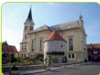
CERKEV SV. NIKOLAJA IN OBRAMBNI STOLP