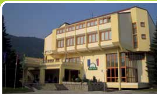
GARNI ŠPORT HOTEL PREBOLD