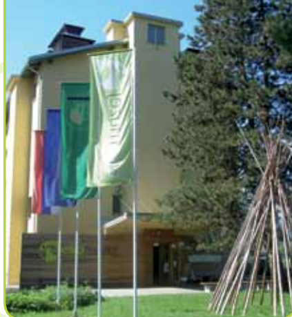
EKOMUZEJ HMEJLARSTVA IN PIVOVARSTVA SLOVENIJE

Ekomuzej hmeljarstva in pivovarstva Slovenije Cesta Žalskega tabora 2 3310 Žalec www.ekomuzej-hmelj.si