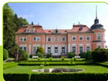
PARK IN GRAŠČINA ŠENEK

Prijazna pokrajina med Savinjo in Goro Oljko se ponaša z zanimivo zgodovino, ki sega prav v rimske čase. Resnično pa je zaživela s svojo Komendo (Hailenstein) pred več kot 800 leti. Dolga stoletja so ji torej zgodovino krojili Maltežani, kasneje Celjski grofje in dominikanci. Vsi so pustili svoje sledi, ki so se ohranile za današnji čas, saj so simboli občine povezani z dediščino malteških viteзов in Komendo.