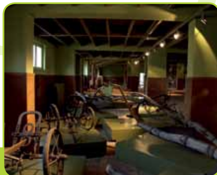
ZBIRKA ORODIJ V EKOMUZEJU