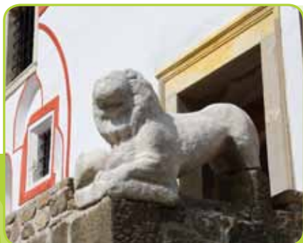
GRAD KOMENDA, ANTIČNI LEV

GRAD KOMENDA že od sredine 12. stoletja stoji na skalni vzpetini, okoli katere se razteza današnja Polzela. Posebnost gradu je antični lev iz pohorskega marmorja, postavljen na stopniščno ograjo tik ob glavnem vhodu. Grad predstavlja s svojo dominantno lego, arhitekturnimi prvini in z zgodovinsko sporočilnostjo pomemben kulturni, zgodovinski in etnološki spomenik.