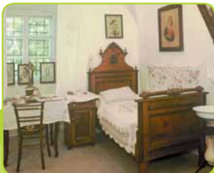
ZBIRKA PREBOLD SKOZI ČAS

GARNI ŠPORT HOTEL PREBOLD razpolaga z eno- in dvoposteljnimi sobami ter velikim luksuznim apartmajem. Hotel je na voljo za organizacijo prireditev, kot so poroke (za mladoporočence tudi kraljevski apartma z masažno kadjo), zabave, zaključki, vse vrste praznovanj v večnamenskih prostorih in konferenčni dvorani.