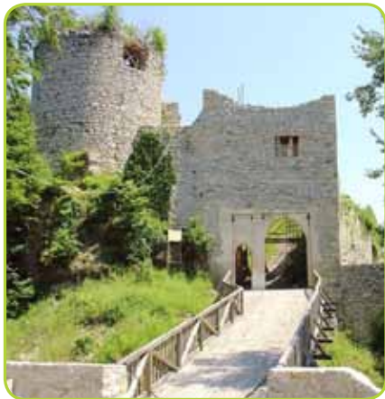
RUŠEVINE GRADU ŽOVNEK