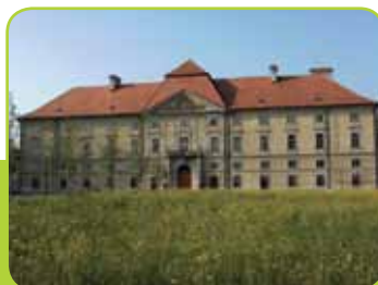
DVOREC NOVO CELJE

Mesto Žalec je gospodarsko, upravno in kulturno središče Občine Žalec ter Spodnje Savinjske doline. Je prijazno in urejeno mesto živahnega utripa, z okolico, ki nudi izjemen preplet naravne in kulturnozgodovinske dediščine.