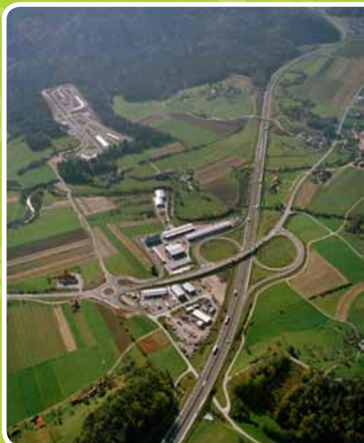
CENTER VARNE VOŽNJE

Tečaji so namenjeni vsem voznikom in voznikom. Tečaji trajajo od 8. do 16. ure, vsebina pa zanimivo in razumljivo vodi udeleženca skozi različne stopnje zahtevnosti vadbe tehnik varne vožnje. Tečaj ima krajši teoretični del ter večurni program vadbe v praksi. Vaje se izvajajo na mokri in spolzki podlagi, kar na varen in učinkovit način ponazarja situacije, ki se pogosto pripetijo v vsakdanjem prometu.