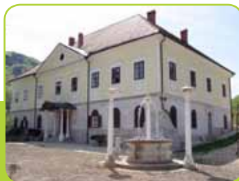
GRAŠČINA AVŽLAK (PRAJHAUS) - MITNICA

Legenda pravi, da je bilo nekoč v kotlini, kjer danes leži trg, jezero, ob katerem je živel veliko vran. Po osušitvi jezera je na tem mestu zrastle naselje, ki so ga poimenovali po močvirskih prebivalcih. Zato je tudi v trškem grbu, ki od leta 1868 simbolizira trg Vransko, upodobljena vrana, stoječa na veji prikrajšanega smrekovega debla.