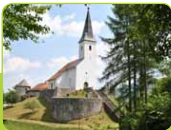
CERKEV SV. HIERONIMA NA TABORU