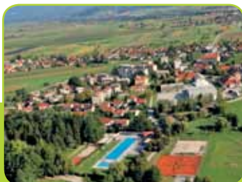
PREBOLD IZ ZRAKA