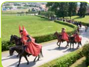
MALTEŠKI POZDRAV POLETJU