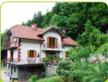
TURISTIČNA KMETIJA WEISS

Občina Tabor in TD Tabor Tabor 21 3304 Tabor T: +386 (0)3 705 70 80 www.obcina-tabor.si