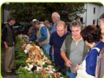
SEJEM DOBROT S KMETIJ, GOBARSKA RAZSTAVA

TD Polzela Polzela 8 3313 Polzela T: +386 (0)3 703 32 20 www.td-polzela.si