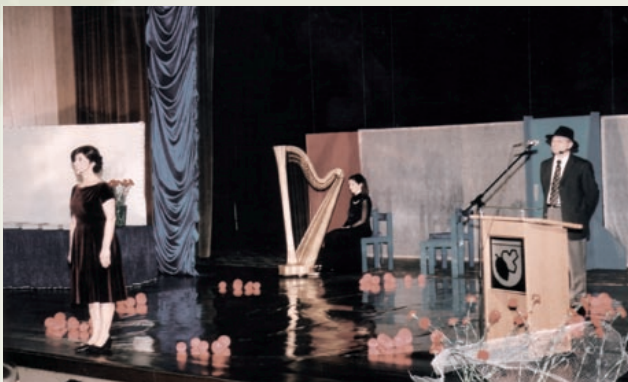
Z osrednje proslave ob slovenskem kulturnem prazniku 2005

Na odru Doma najde svoje mesto tudi večina občinskih proslav, med njimi je naša osrednja prireditev, proslava ob slovenskem kulturnem prazniku, na kateri podelimo najvišja, Savinova priznanja in plakete za dosežke na različnih področjih kulture. Predvsem na teh osrednjih prireditvah v veliki meri sodelujejo domača kulturna društva, s katerimi tudi sicer redno sodelujemo.