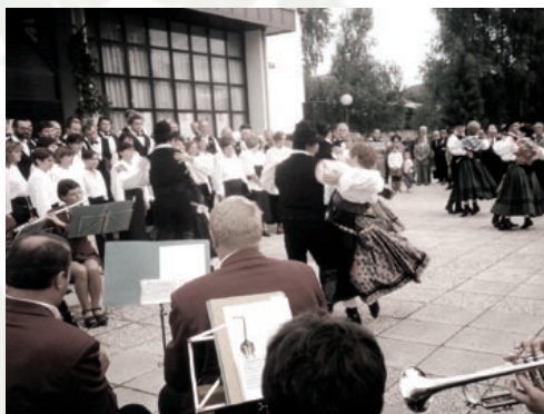
130-letnico II. slovenskega tabora smo praznovali množično in veselo.

Zavod za kulturo je živel 10 let. V njegovi sestavi sta bila tudi Občinska matična knjižnica in Zveza kulturnih organizacij, ki je k zavodu spadala zgolj formalno, saj je izvršni odbor zahteval popolno avtonomijo zanjo. Tudi knjižničarji se z novo organiziranostjo nismo strinjali, vendar so vodstva družbeno-političnih organizacij želela z malo denarja doseči velike rezultate, kar jim je uspelo, vendar na račun razvoja lokalnih knjižnic, saj volje niso pospremili tudi s pripravljenostjo, da bi zavod kadrovsko okrepili. Zavod je imel velike ambicije in Žalec je postal pomembno kulturno središče, saj se je z ustvarjalnostjo lahko primerjal z najpomembnejšimi kulturnimi in umetniškimi središči Slovenije. Vedno znova je presenečal z novimi oblikami ustvarjalnosti. Sredstva, namenjena za njegovo delovanje, so zavod vedno bolj potiskala v tržno naravnost, številni sponzorji in donatorji so bili vse bolj soustvarjalci kulturne politike, saj nam je prav z njihovo naklonjenostjo uspelo uresničiti številne projekte.