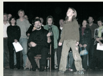
Z vaje za zadnjo uprizoritev Hmeljske princese v novembru 2005