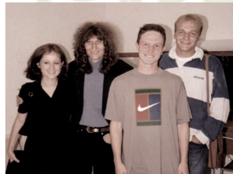
Smolarjeva iskrena prijaznost je bila nalezljiva.