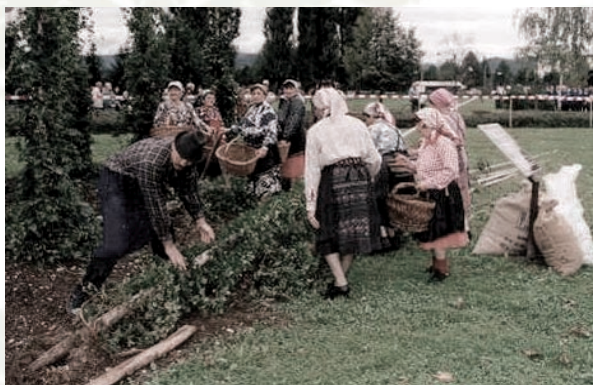
Obiranje hmelja na star način na njivi pred Domom II. slovenskega tabora

Z našo turistično vodniško službo želimo turistom zagotoviti zanimivo predstavitev turističnih znamenitosti naše občine in jih animirati tako, da se bodo zadovoljni od nas poslovili ter se k nam z veseljem vračali. Razlog za povratke pa je poleg prijaznih ljudi in pestrosti turistične ponudbe tudi čisto, človeku prijazno okolje. Zanj poleg pristojnih institucij skrbimo tudi turistični delavci in vsi, ki spoštujemo zdravo in lepo naravno okolje. Prizadevanja po urejenosti okolja vzpodbujamo v sodelovanju z Občino Žalec in Zvezo TD