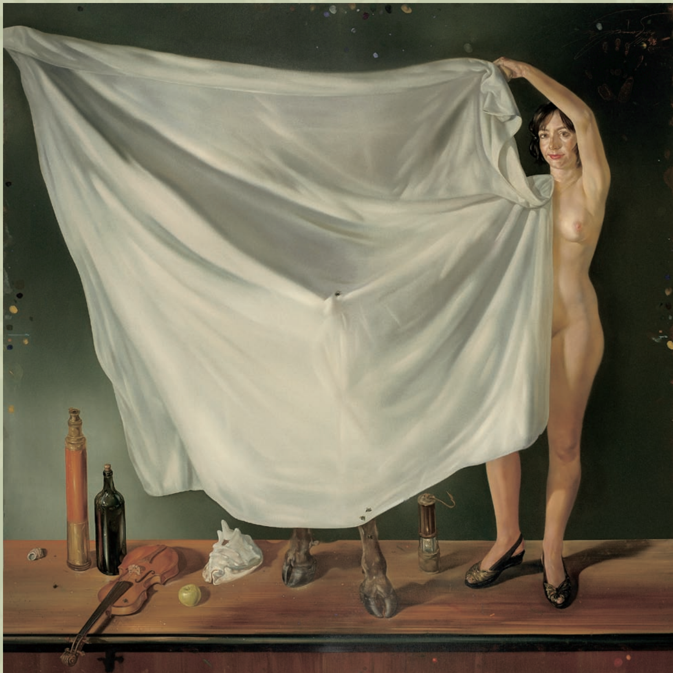
Rudi Španzel: Belcebub ali Gospodar muh (alegorija gledališča), 1994, olje na platno, 200x200 cm