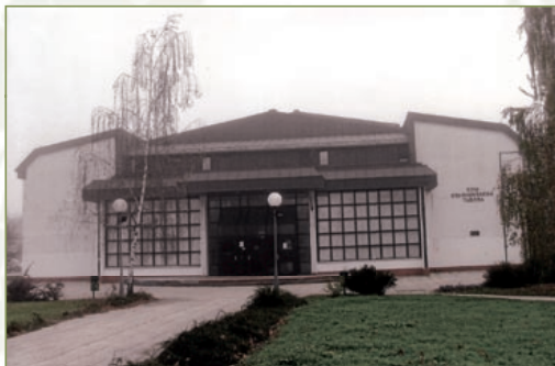
Fotografija doma iz 2005

Ob 20-letnici Doma II. slovenskega tabora se zahvaljujem vsem, ki ste v času od prve ideje do danes prispevali svoj delež v njegovo raznoliko življenje in čestitam tistim, ki danes domujete v njem: