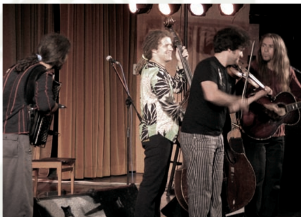
Skupina Terrafolk je dvakrat v enem večeru napolnil dvorano Doma.

Novi program predvideva razstave akademskih slikarjev, kiparjev, oblikovalcev, ki so v slovenskem likovnem prostoru že uveljavljeni ter mladih, ki v svojem ustvarjalnem delu odstirajo nova pota. Eden od pogojev za razstavljanje je ta, da dela na Slovenskem še niso bila razstavljena, razen seveda pri retrospektivah. Navežali bomo sodelovanje z drugimi galerijami in med razstavljalce pritegnili tudi po kakšnega umetnika iz tujine.