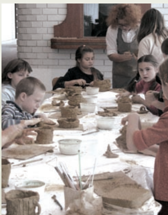
Prve jesenske počitnice so mnogi osnovnošolci preživeli ustvarjalno.

Na odru Doma najde svoje mesto tudi večina občinskih proslav, med njimi je naša osrednja prireditev, proslava ob slovenskem kulturnem prazniku, na kateri podelimo najvišja, Savinova priznanja in plakete za dosežke na različnih področjih kulture. Predvsem na teh osrednjih prireditvah v veliki meri sodelujejo domača kulturna društva, s katerimi tudi sicer redno sodelujemo.