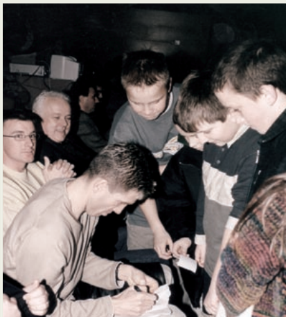
Srečko Katanec, gost na prireditvi Šport 2002

Tako današnja organizacijska enota ŠPORT izhaja iz nekdanje zelo aktivne Telesno-kulturne skupnosti, kasneje Zveze telesno kulturnih organizacij, in temelji na še vedno delujoči Zvezi športnih društev občine Žalec. Vsebina oz. rdeča nit delovanja pa je ves čas praktično enaka: bolj promovirati gibanje kot sestavni del življenja.