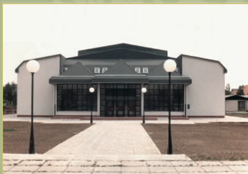
Fotografija doma iz leta 1985

Kadar in kjer srce lahko slavi vsak prihajajoči, prebujajoči se dan – tisto postane dom.