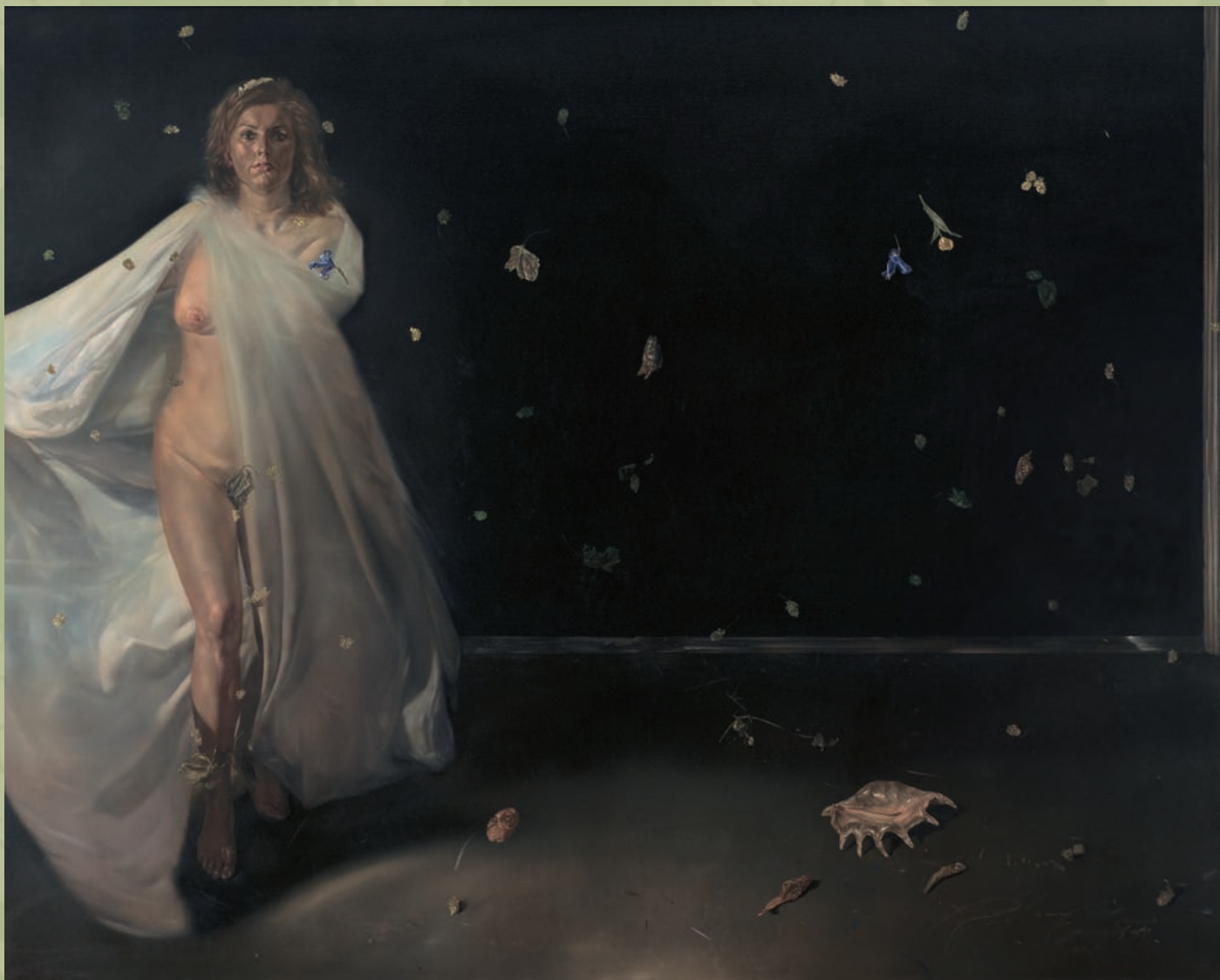
Rudi Španzel.: Hmeljska princesa – Pozno poletje (alegorija literature in poezije), 1983-85, olje na platno, 200x250 cm