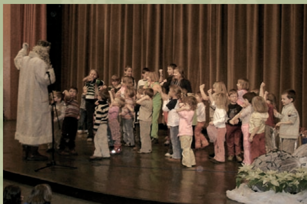
Dedek Mraz na obisku pri najmlajših obiskovalcih

Turistično ponudbo dopolnjujemo in bogatimo s turističnimi projekti ter prireditvami (Pustni karneval, Srečanje turističnih društev s podeželja, Kolesarjenje po Spodnji Savinjski dolini, Pohod po hmeljski poti, Hmeljarski likof, Veseli december, Silvestrovanje na prostem ...) Vsako leto namenimo posebno pozornost svetovnemu dnevu turizma, v veselje pa nam je, da je turizem naš vsakdan.