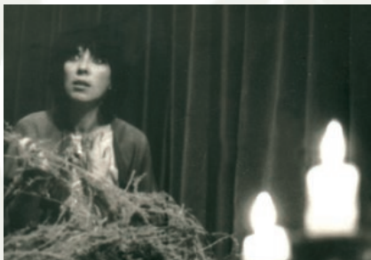
Še danes je v spominu živa izvedba recitala Svetlane Makarovič Pelin žena