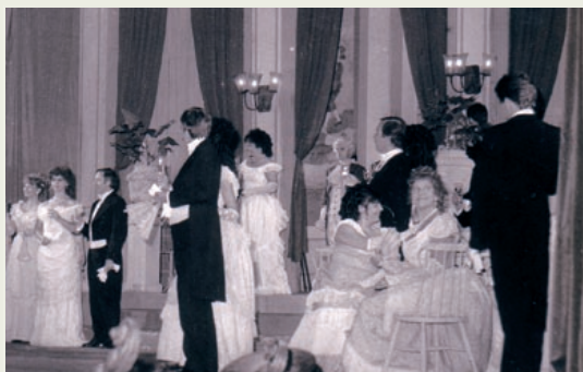
Praznični kulturni teden se je zaključil z opero Traviata v izvedbi mariborske operne hiše