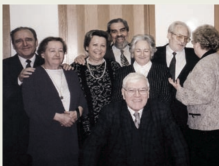
Zgodovinska fotografija: pesniki Pesmi štirih s soprogami in poezijo