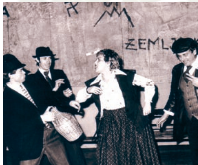
Hamlet v Blatnem dolu v režiji Iztoka Valiča

Nove možnosti kakovostnega dela pa je odpiral dom tudi domačim ljubiteljem. Pri DPD Svoboda je poleg vokalno-instrumentalne in plesne dejavnosti ter kina ponovno oživela dramska dejavnost, ki je k delu privabila tudi okoliške izvajalce. Vaje na sodobno opremljenem odru so bile hkrati tudi koristne izobraževalne delavnice, ki so bile večkrat organizirane še prek ZKD Žalec za člane gledaliških skupin naše in sosednjih občin v regiji.