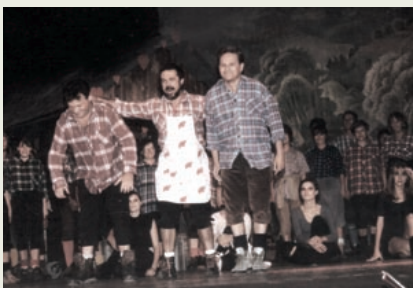
Prizor iz uprizoritve Planinske rože, 1994