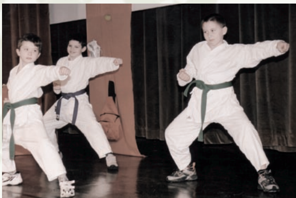
Mladi karateisti na prireditvi Šport 2004

Za popestritev občolskih dejavnosti spomladi dodamo še akcijo Razpni mo jadra, ki s prek petnajstimi prireditvami skozi daljše obdobje na svojstven način stimulira vse starostne skupine h gibalni aktivnosti. Poletje brez vode je tako kot zima brez snega. Zato v poletnem času zaživijo kopalniško plavalni izleti v eno izmed znanih slovenskih zdravilišč oz. termalnih parkov. Jesenski čas zaznamujejo: ulični tek, Vebrov memorial ter test hoje kot dodatna gibalno-zdravstvena aktivnost.