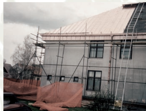
Obnova strehe leta 1997

Matična knjižnica je nabavljala in opremljala knjižno gradivo za vse knjižnice in s sodelovanjem Ministrstva za kulturo, ki nam je priskrbelo prve računalnike, prešlo na računalniško izposojanje gradiva. Kasneje - leta 1995 pa smo prešli na enoten slovenski knjižnično informacijski sistem Cobiss.