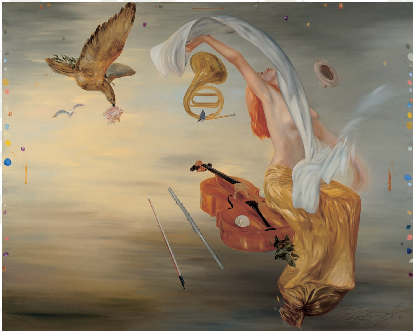
Rudi Španzel: Sveta Cecilija (alegorija glasbe), 1999, olje na platno, 200x250 cm