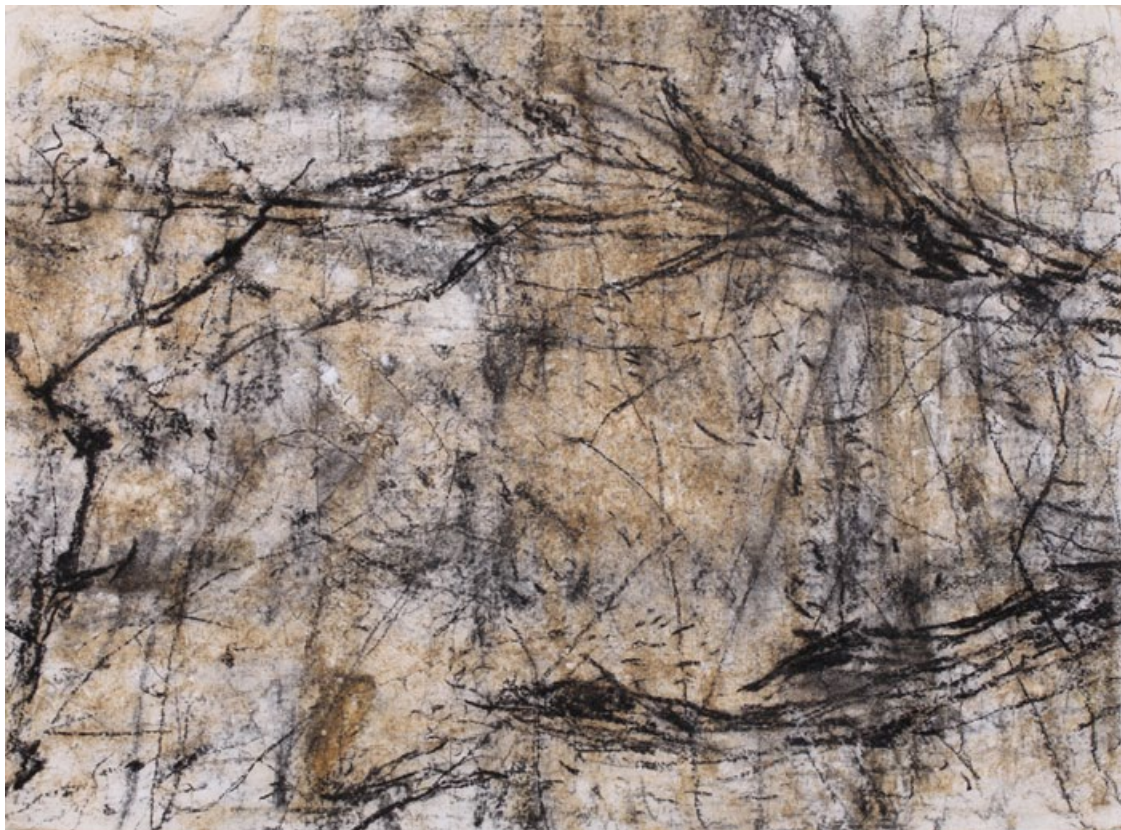
Stojan Grauf , Vodne slike, 2013, risba z ogljem in naravnimi pigmenti, 57 x 77 cm

Avtoričin intimni pogled v okolje, vztrajna roka in duševna umirjenost so bistvo za nastanek poetičnih podob narave, te ne izžarevajo samo telesne moči, ampak še notranjo moč upodobljenega. Ob slikah mogočnih dreves se zavemo svoje minljivosti in odtujenosti. Saj si ne znamo vzeti časa in se razveseliti običajnih naravnih pojavov, kot je preobrazba brsta v list ali popka v cvet, spregledamo jesensko barvitost gozda, ne slišimo tišine zasnežene pokrajine.